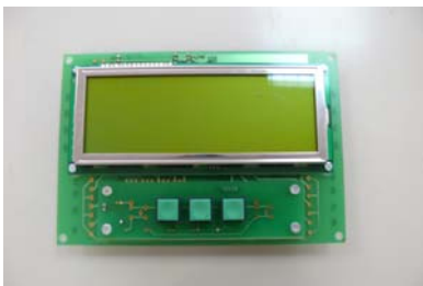
CODIGO: 219.004 DESCRIPCION: DISPLAY CLAMARTIC RC