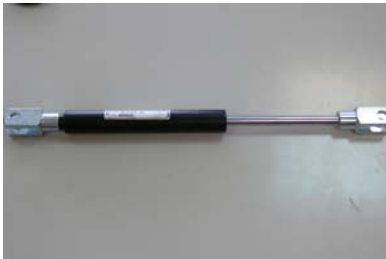
CODIGO: 59AMORT DESCRIPCION: AMORTIGUADOR CLAMATIC.