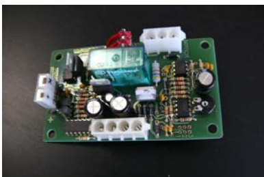
CODIGO: TSGCLCR300 DESCRIPCION: THERMOSTATO SEGURIDAD CLAMATIC