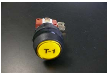
CODIGO: 670.003 DESCRIPCION: PULSADOR TIEMPO 1