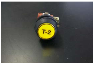
CODIGO: 670.004 DESCRIPCION: PULSADOR TIEMPO 2