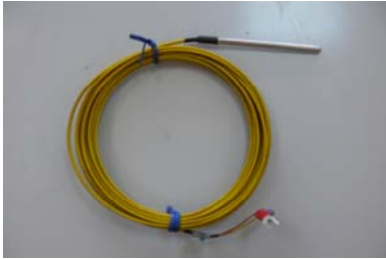
CODIGO: XXSONTCLAM DESCRIPCION: SONDA TERMOPAR PARTE SUPERIOR