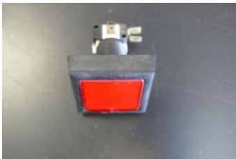
CODIGO: 59PULEMER DESCRIPCION: PULSADOR DE EMERGENCIA