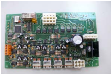
CODIGO: XXCLAMRC DESCRIPCION: COMPUTADORA CLAMATIC RC