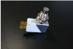
CODIGO: XXMICRES DESCRIPCION: MICRORRUPTOR FIJACION BRAZO